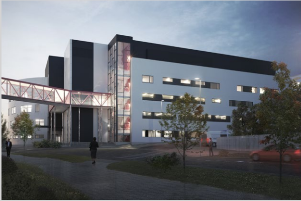
Näkymä Kuumaan sairaalaan Mannerheimintieltä.

KESKUSSAIRAALA MUUTTUU MODERNIKSI PÄIVYSTYSSAIRAALAKSI JA HYVINVOINTIKESKUKSEKSI